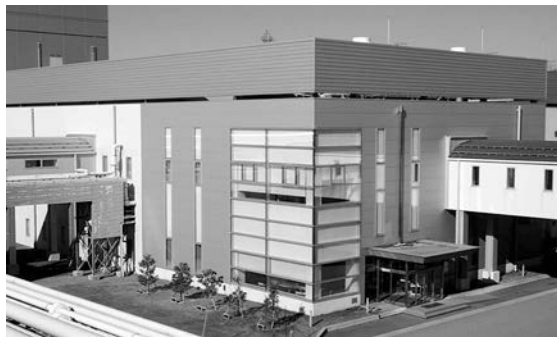
パワーデバイスの主力前工程拠点である加賀東芝エレクトロニクス